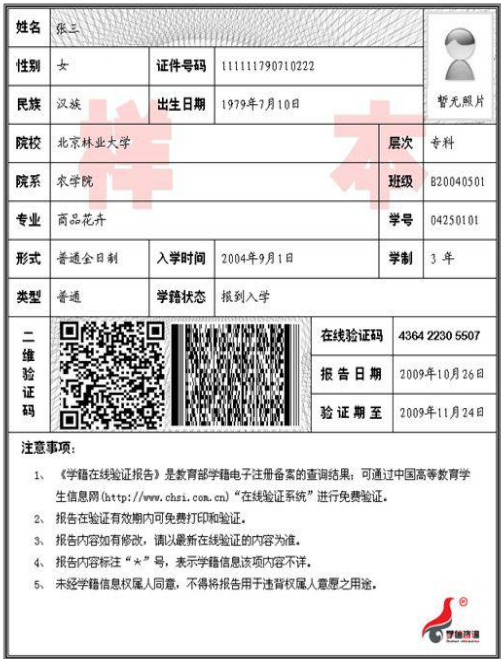
教育部学籍在线验证报告照片示例图