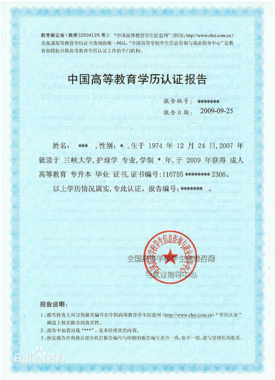
教育部学历认证报告照片示例图