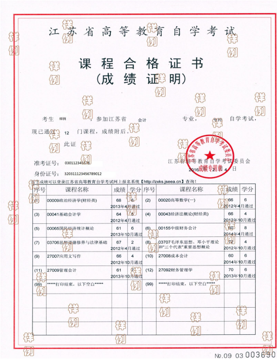
省级高等教育自学考试办公室成绩证明照片示例图