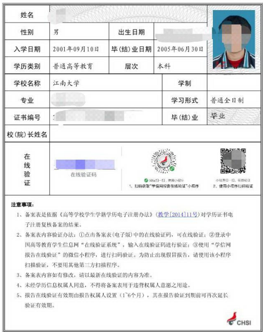
教育部学历证书电子注册备案表照片示例图