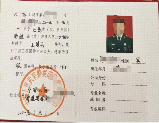
退出现役证照片示例图