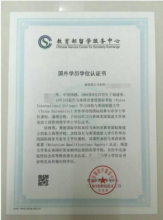
教育部留学服务中心出具的认证报告照片示例图

户口簿首页（公安部门盖章页）及本人信息页照片，也可提供由公安部门出具的户籍证明原件照片。