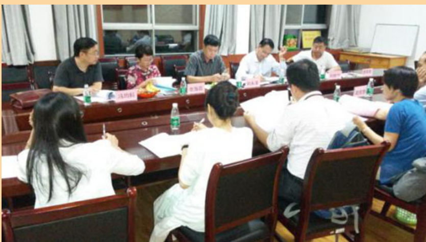
(供稿:会计学院 陈秀丽)

据悉,为进一步完善人才培养机制,此前,会计学院多次邀请专家学者及企业界代表,进行了多轮培养方案论证,经过不断修订完善,人才培养更趋于科学。